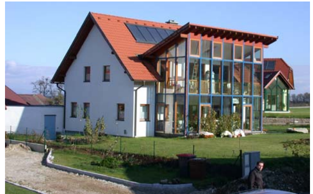
Niedrigenergiehaus mit Wintergarten