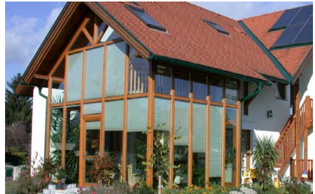
Saniertes Althaus mit Wintergarten

Außenseite, da die hoch stehende Sommersonne durch das Glasdach intensiv einstrahlt. Es kommt leichter zu Schäden durch die Schneelast im Winter. Sie verschmutzen sehr leicht und sind schwer zu reinigen.