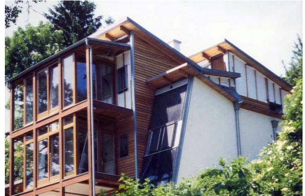
Niedrigenergiehaus bei Klosterneuburg

Wintergarten ist Lärchenholz am besten geeignet. Pflegeleicht ist ein Fußboden mit herausnehmbarem Lattenrost, darunter liegt eine 30 cm dicke Schicht aus Stampflehm. Lehm ist ein guter Feuchtigkeitspuffer und Wärmespeicher. Fliesen sind zwar pflegeleicht, aber im Winter immer kalt und im Sommer bei Sonnenschein sehr heiß.