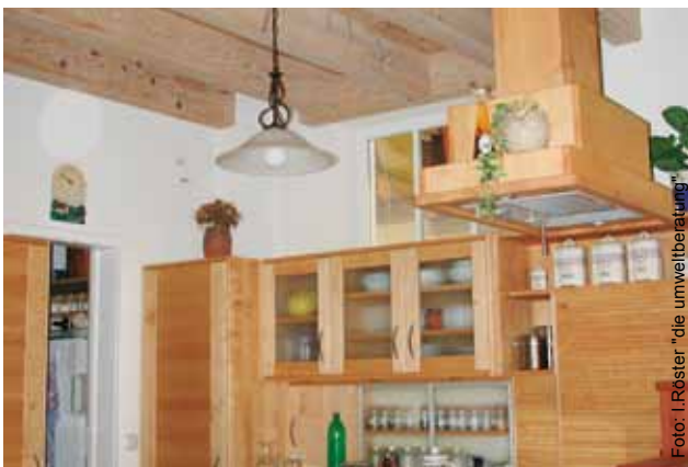
Aus Küche, WC und Badezimmer wird die verbrauchte feuchte Luft abgesaugt