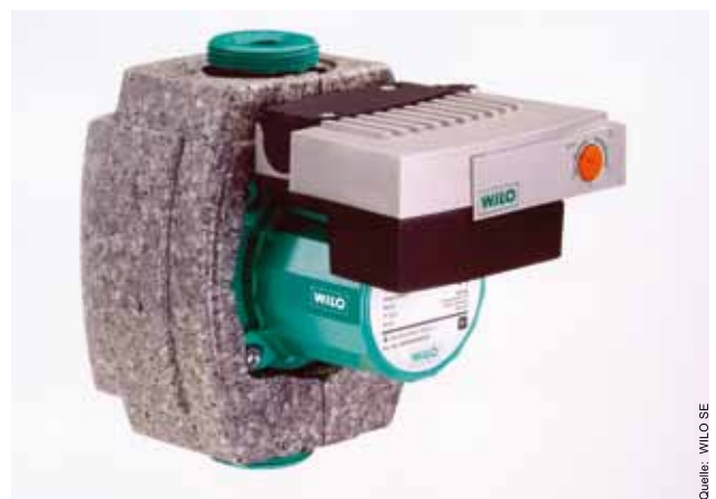
Abbildung 3: Hocheffizienzpumpe mit Wärmedämmung

...auch bei der Heizungspumpe. Denn schließlich wollen Sie ja die Wohnräume heizen und nicht den Keller. Generell sollten alle Metallteile (Rohre, Verteiler, Ventile) des Heizsystems besonders gut gedämmt werden. Lieber mehr als weniger!