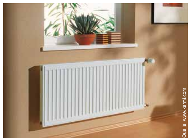
Zweireihiger Plattenheizkörper mit Thermostatventil

Am Markt werden auch elektrisch betriebene Heizkörper angeboten. Sie werden häufig in Wohnungen eingesetzt, um die Installationskosten der Heizanlage gering zu halten. Sie sind nicht zu empfehlen, da Strom die teuerste Energieform ist.