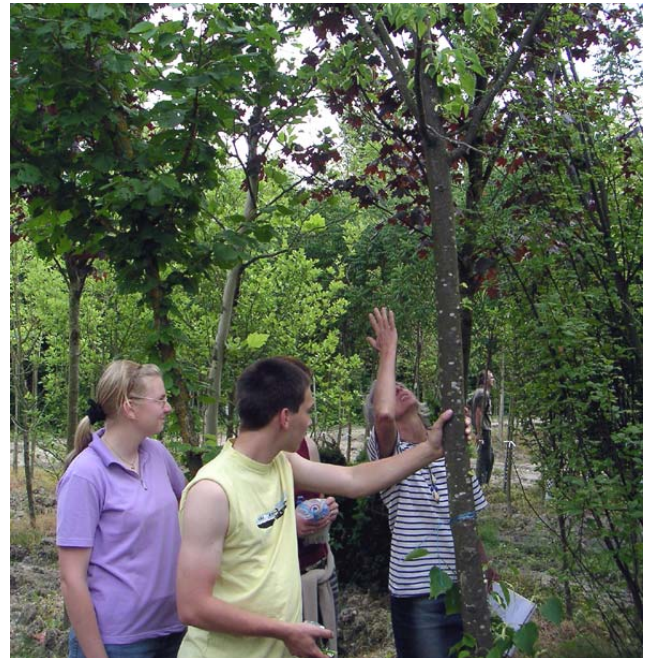
Sorgfältige Baum-Auswahl in der Baumschule