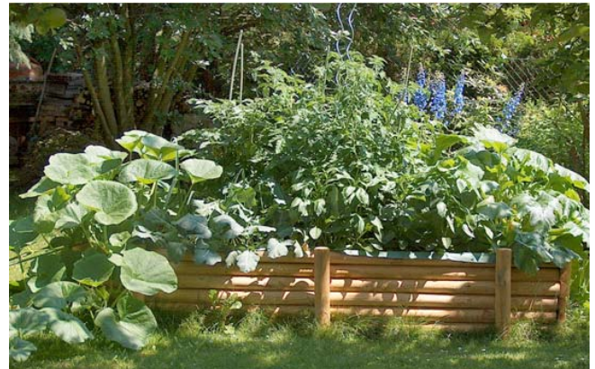
Große Ernte auf kleiner Fläche

Die Einfassung von Hochbeeten kann aus verschiedensten Materialien gebaut werden. Am