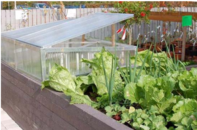
Hochbeet mit Frühbeet

Zwischen die Schichten können Sie Urge- steinsmehl für eine bessere Zersetzung und zur Förderung des Bodenlebens einstreuen. Füllen Sie Ihr Hochbeet ruhig ganz auf. Es sinkt durch den Verrottungsprozess pro Jahr ca. 8 – 10 cm ein. Dies können Sie jedes Jahr durch Auffüllen mit Komposterde im Frühjahr ausgleichen.