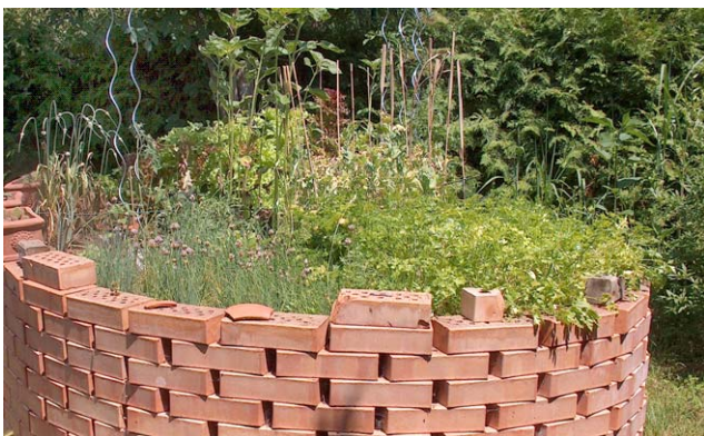
Rundbeet aus Lochziegeln, mit Eisenstäben fixiert

Für RollstuhlfahrerInnen eignen sich Tischbeete besser, weil sie von allen Seiten unter das Beet fahren und so mit geradem Rücken bequem arbeiten können. Die ursprüngliche Variante sind Holzkisten oder Blumentröge, die auf geeignete, standfeste Gartentische gestellt werden. Die Luxusversion ist ein meist aus Holz gebautes Beet auf vier Beinen. Die Höhe sollte ca. 0,7 m betragen. Dabei ist eine Neigung von 2 - 3 % mit seitlichem Abfluss wichtig. Sorgen Sie für ausreichende Standfestigkeit Ihres Tischbeetes. Beachten Sie bei Tischbeeten und bei Hochbeeten auf Balkonen und Terrassen, dass nasse Erde ein hohes Eigengewicht hat!