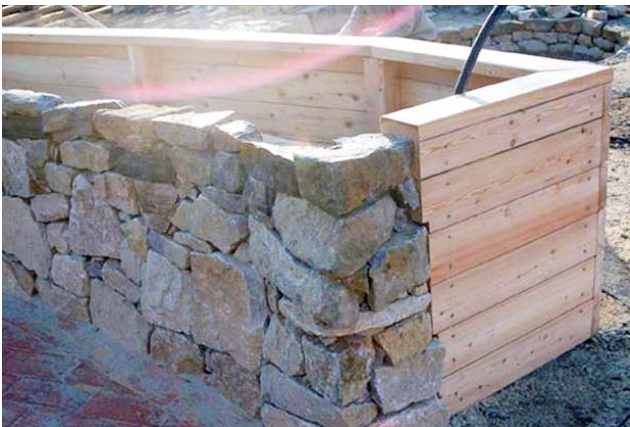
Selbstbau im Materialmix

Die ideale Breite für ein Hochbeet beträgt 2x die Armlänge (rund 1,4 - 1,6 m). Sie sollten bequem mit einer Armlänge in die Mitte des Beetes reichen. Die Länge und Form kann beliebig gewählt werden. Die angenehmste Arbeitshöhe liegt auf Hüfthöhe, also je nach Körpergröße der Gärtnerin bzw. des Gärtners zwischen 0,7 und 1 Meter Höhe.