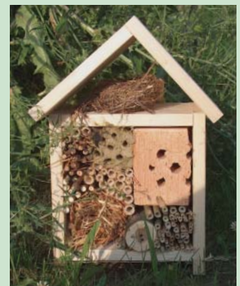
Hängen oder stellen Sie das Haus an einer wettergeschützten Stelle auf, z. B. südseitig an eine Hausmauer