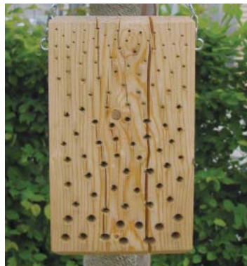
Einfach zu basteln ist ein Nistholz mit verschiedenen großen Löchern

Zumindest ein alter Baumstamm oder ein Asthaufen findet in jedem Garten Platz.