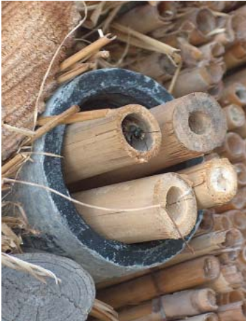
Eine Wildbiene hat schon Unterschlupf gefunden