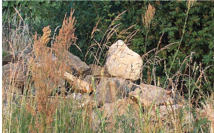
Steinhäufen sind ein Gestaltungselement in naturnahen Gärten und bieten ein Versteck für viele Tiere

Spechte, Hirschkäfer, Igel, Fledermäuse und viele andere Nützlinge sind auf Totholz, alte Bäume oder Asthaufen angewiesen.