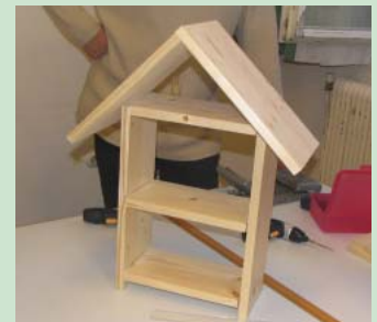
Bauen Sie keine Rückwand, damit das Haus für die Tiere von beiden Seiten zugänglich ist