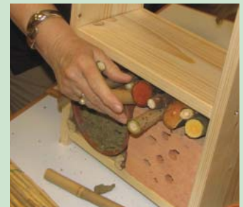
„Einrichten“ können Sie das Hotel mit Stängeln, durchbohrten Hölzern und Tonziegeln