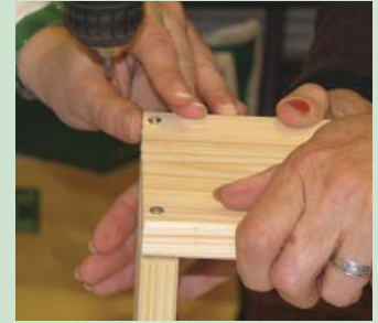
Für ein Nützlingshotel müssen zuerst Fichtenholzbretter verschraubt werden