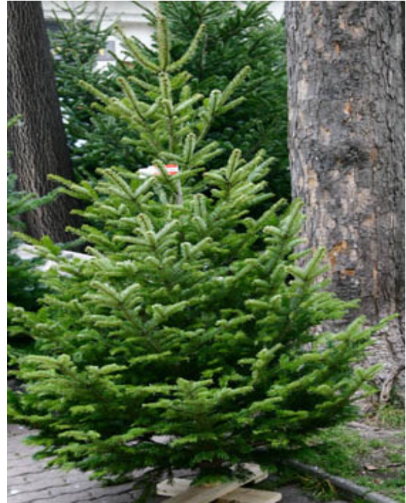
Baum aus Österreich

Bio-Christbäume werden nach der EU Verordnung 2092/91 des biologischen Landbaus produziert. Diese verbietet den Einsatz von synthetischen Düngemitteln und Pestiziden. Die Verwendung von biologischen Jungpflanzen ist Pflicht. Damit die kleinen Bäume nicht mit hohen Gräsern um Licht und Wasser kämpfen müssen, weiden z. B. Schafe zwischen den Bäumen. Jährlich werden die Bio-Christbaum-