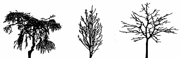
Beispiele verschiedener Kronenformen

Ein gleichmäßiger Kronenaufbau und ein durchgehender Leittrieb garantieren die Ausbildung einer schönen und sicheren Krone.