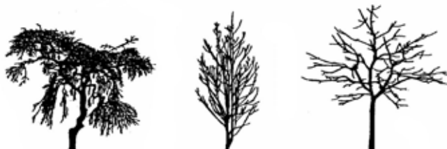
Beispiele verschiedener Kronenformen

Bäume werden in verschiedenen Größen angeboten. Jüngere Bäume können sich besser an ihren neuen Standort anpassen als große Exemplare. Baumgrößen werden durch den Stammumfang in 2 cm-Sprüngen angegeben: 8-10 cm, 10-12 cm, usw. Die Höhe des Kronenansatzes am Stamm wird durch die Ausdrücke Hochstamm (Ansatz ab 1,8 m) und Halbstamm (Ansatz ab 1,2 m) angegeben. Qualität und Anwuchspflege entscheiden über das üppige Gedeihen Ihres Baumes.