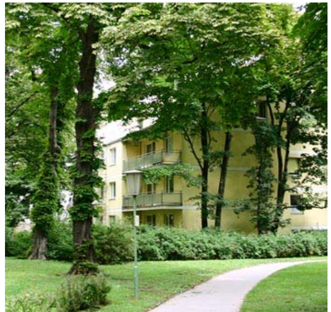
Das grüne Blätterdach filtert Staub und Schadstoffe

Sie bieten zahlreichen Tieren ein Zuhause, die uns durch ihren Gesang erfreuen oder auf der Jagd nach Schädlingen das biologische Gleichgewicht im Garten erhalten.