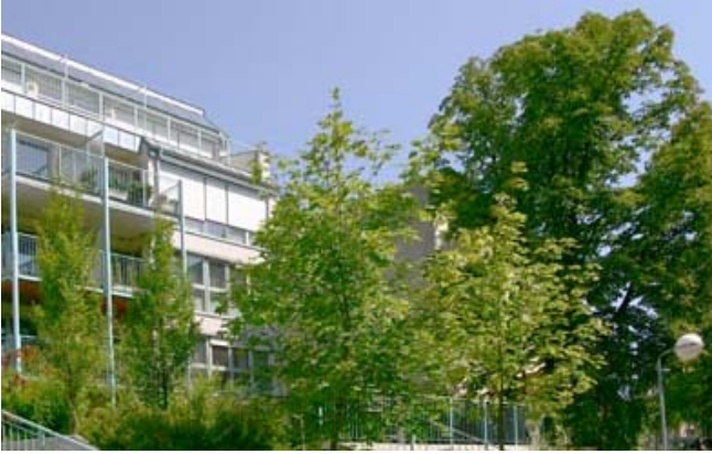
Bei strahlend blauem Sommerhimmel spenden Bäume wohlthuenden Schatten

Für jeden Garten und Standort gibt es den passenden Baum. Nehmen Sie sich Zeit für die Auswahl Ihres Hausbaumes, um für viele Jahrzehnte Freude, Energie und Ruhe von ihrem besonderen Baum erleben zu können.