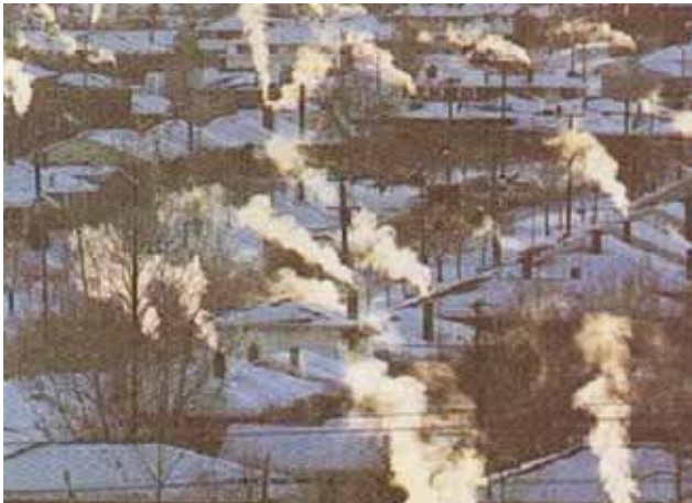
... als Geld und Schadstoffe beim Schornstein rausblasen!

Bei den Anfangsinvestitionen stehen geringere Kosten durch den Wegfall von Heizanlage und Heizkeller den Zusatzkosten für Lüftungsanlage und Wärmedämmung gegenüber. Der erhöhte Wohnkomfort lässt sich monetär nicht ausdrücken. In den nächsten Jahren ist durch Serienfertigung der notwendigen Komponenten (Fenster, Haustechnik) mit weiteren Preisreduzierungen zu rechnen.