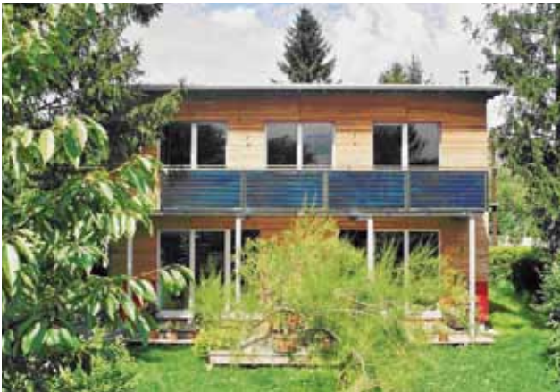
Besser viel dämmen und wenig heizen...

Ein Niedrigenergiehaus braucht viel weniger Heizwärme als ein Gebäude, das nur dem thermischen Mindeststandard der Bauordnung entspricht. Energiesparende Bauweise erfordert einen kompakten Baukörper, die Ausrichtung nach Süden, eine sehr gute Wärmedämmung, gut dämmende Fenster und eventuell eine Lüftungsanlage mit Wärmerückgewinnung.